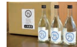
落合酒造場から消毒用として使える高濃度アルコール製品の寄贈