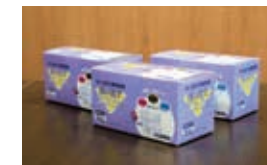
バシフィコ・エナジー株式会社からマスク2,000枚の寄贈