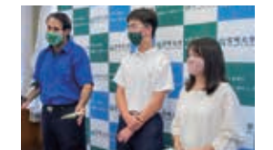
高校生が宮崎大学留学生へ手作りマスク約200枚の寄贈