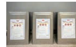
三菱ケミカル株式会社から消毒用として高濃度アルコールの寄贈