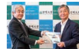
株式会社自然館からフェイスシールドの寄贈