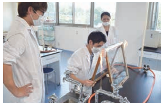
●森林バイオマス実験の様子 囲う物と火で無菌状態をつくります。無菌状態でどこでも実験観察ができるよう、手作りの器具を使って訓練します。

「きのこを通して、さまざまな人、地域との出会いをいただいています。現在は、宮崎大学農学部や工学部、他大学の医学部や薬学部の先生方と共同で研究やプロジェクトを進めています。地域貢献、椎茸の普及活動、観光化など、基礎研究を踏まえて応用し、活動の場を広げていきたいと思っています」。