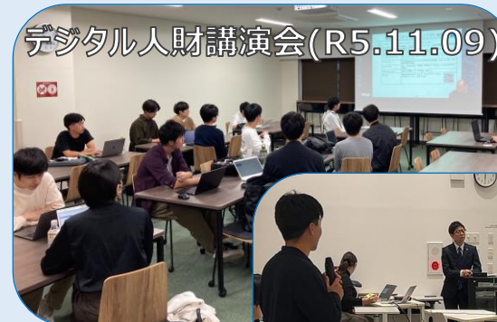
デジタル人財講演会(R5.11.09)